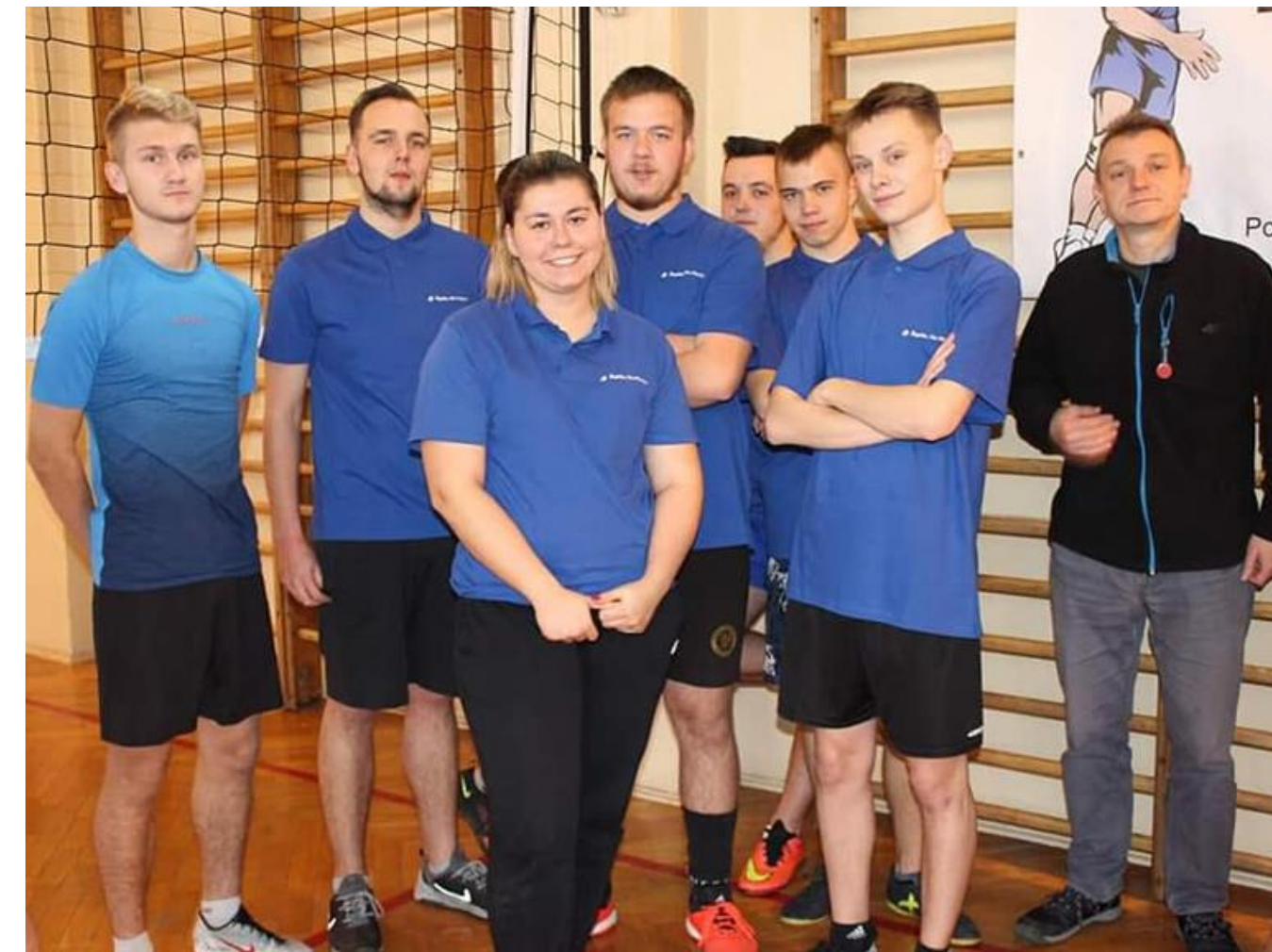
„Drużyna Młodych” zdobyła III miejsce